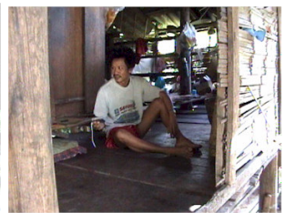
Awm's lamme onkel