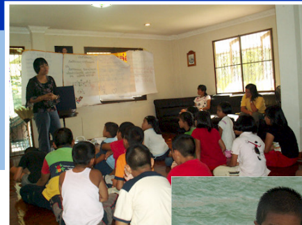
Billeder fra tidligere sommerlejre

Tak for forbøn for alle lejrene - og tak for støtte til udgifterne til disse. ■