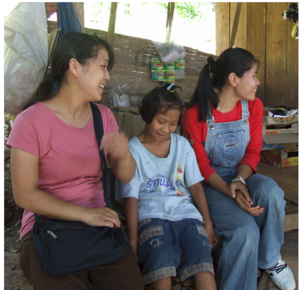
Awm (i midten) sammen med 2 missionærer