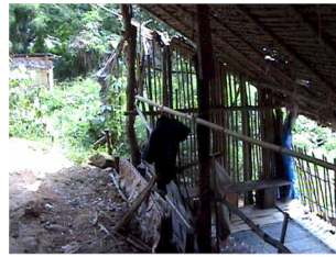
Awm's soveplads for voldtægten