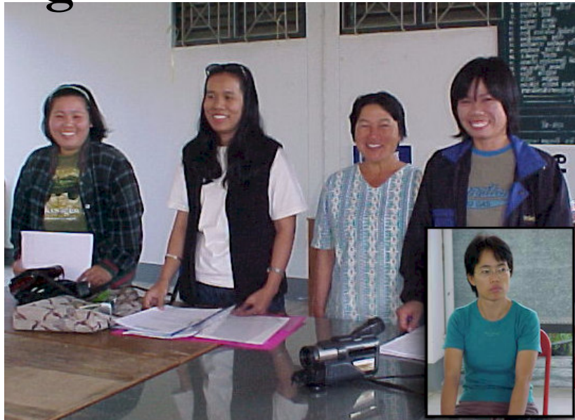
Ang, 3 af de frivillige hjælpere og den lokale læge (indsatte billede)

Derforuden var samarbejdet med den lokale lægeklinik blevet forstærket og udvidet. AIDS