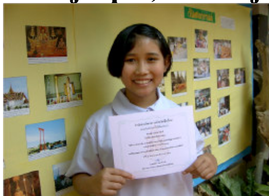
Én af de piger som AIDS Care støtter fremviser stolt sit flidsbevis fra skolen.