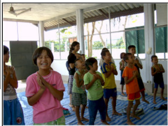
Opmærksomme og glade børn