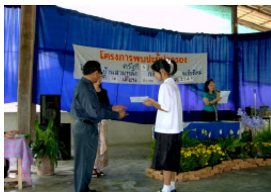
En anden af AIDS Care's piger modtager sit bevis.

AIDS Care arbejder ikke blot med de børn, vi har i vores skoleprojekt, men med alle, både voksne og børn med AIDS, som har brug for hjælp og støtte.