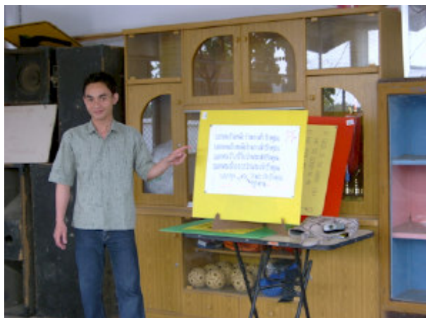
So underviser i søndagsskolen

So er nu i fuld gang med søndagsskole undervisningen. Børnene ser ud til at elske hans undervisning, og So er selv meget