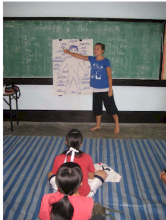
Lea underviser i engelsk

Men når nu vi er blevet taget ud af vores vante kontekst og plantet i Thailand, hvor vi absolut ikke er på hjemmebane, bliver vi