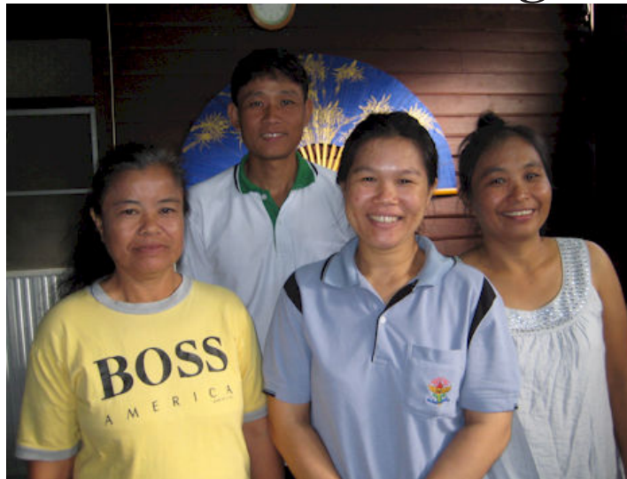
Fra venstre: Pi A, Sor (mand), Yoo-ee og Toi, AIDS Care Mae Hong Son projektleder