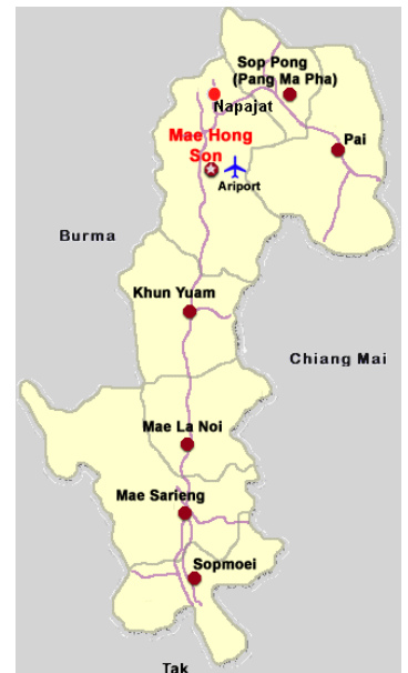
Mae Hong Son provinsen

I forbindelse med at AIDS Care Mae Hong Son i 2010 øger antallet af AIDS ramte børn som støttes fra 25 til 40, stiger antallet af lokale volontører fra 1 til 4.