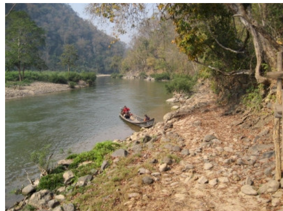
Fra Mae Hong Son området