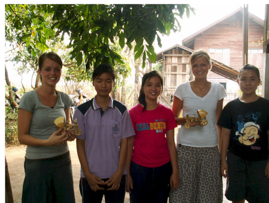
De 3 thailandske piger sammen med 2 danske volontører.

I de videregående uddannelser (svarende til gymnasiet, HTX m.m.) er skolepenge, transport,